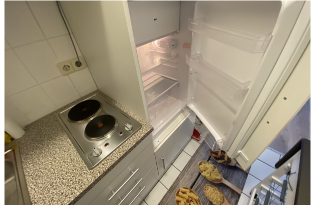
Kühlschrank, neu und unbenutzt