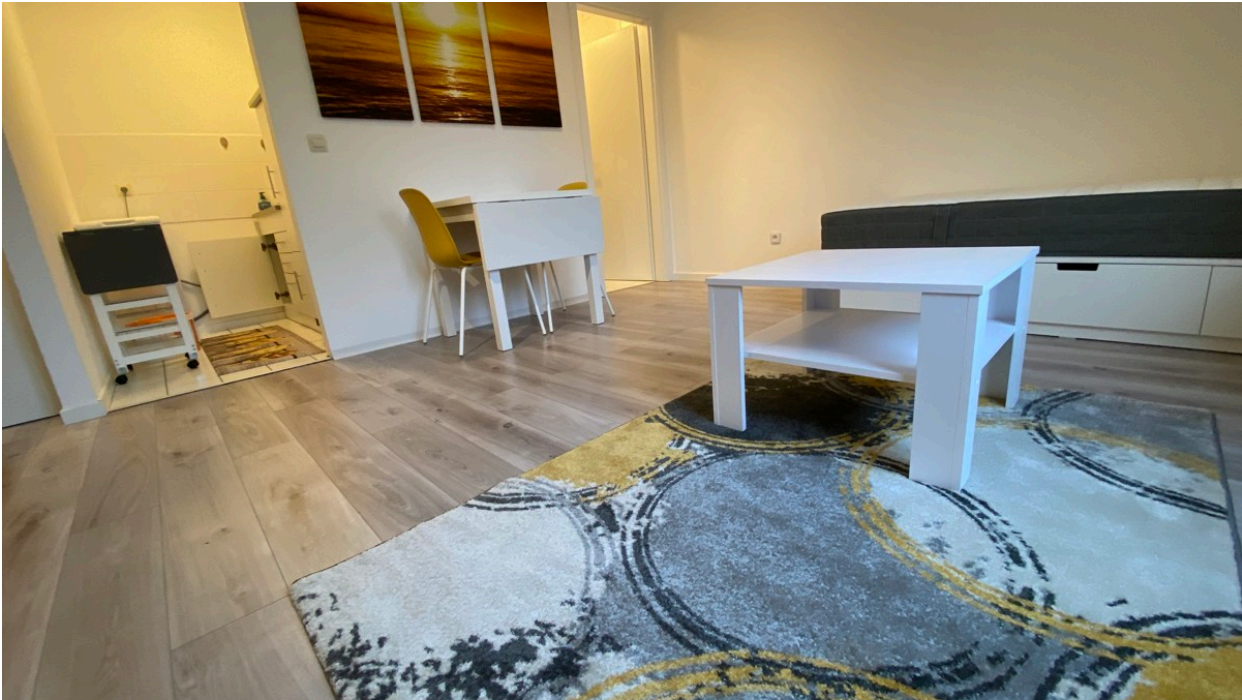
Wohnzimmer möbliert, aktueller Zustand