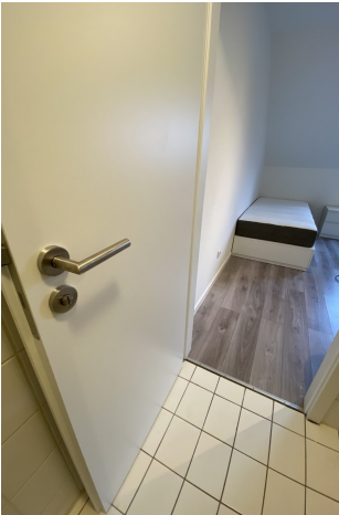
Türen neu 2020