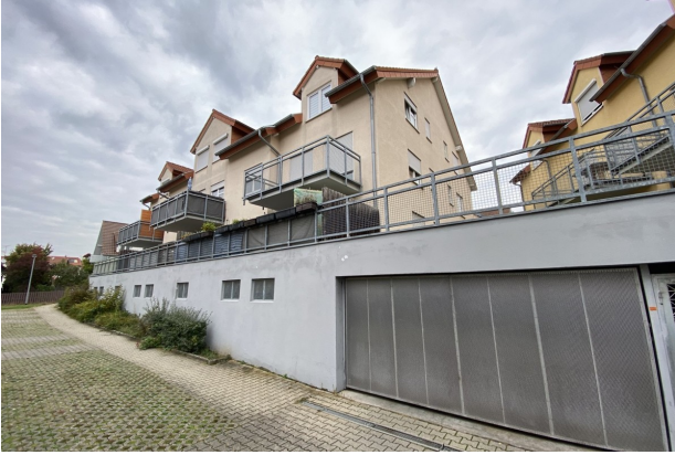
Rückansicht mit Garagentor